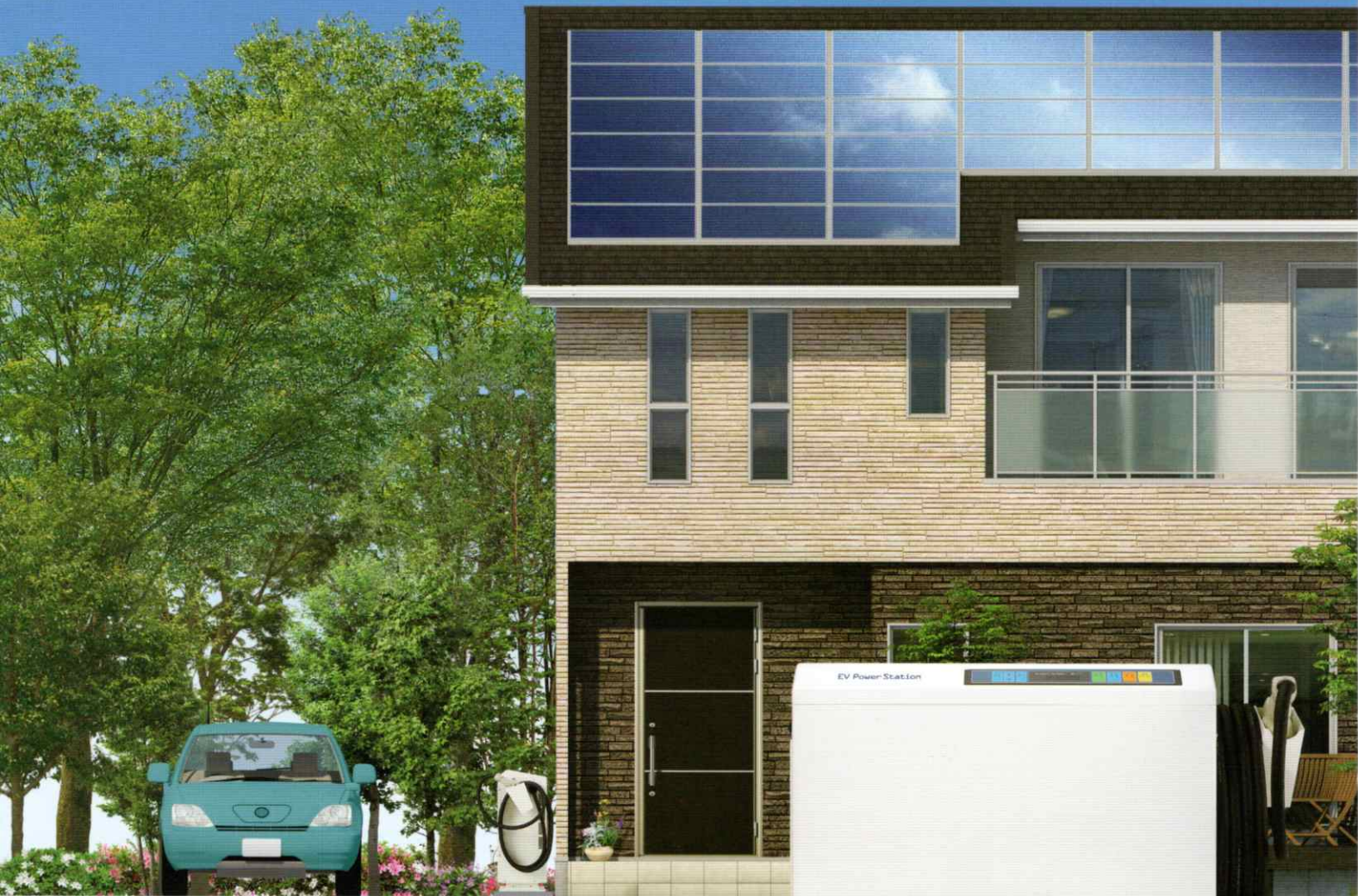
●イラスト・写真はイメージです。実際の設置とは異なります。